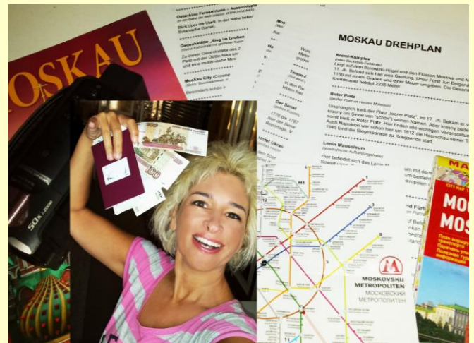
Mit Rubel, Kamera und Stadtplan geht's los