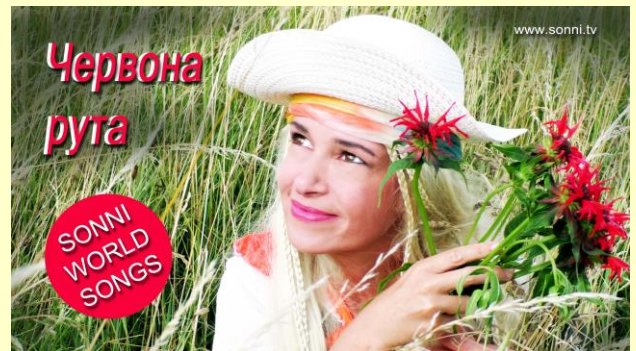
Verträumte Blicke mit der Pflanze der Liebe