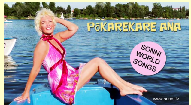
Sommergefühle an der Alten Donau