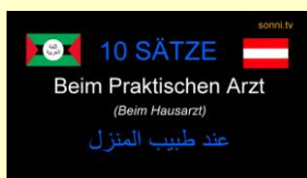
Beim Praktischen Arzt

Ein paar weitere Folgen ihrer Sprachserie „10 Sätze“ ermöglicht es Menschen, die Arabisch als Muttersprache haben, schneller Deutsch zu lernen. Aber es geht natürlich auch umgekehrt. Alle, die an der arabischen Sprache interessiert sind, können mit diesen kurzen Videos ein paar einfache und nützliche Phrasen lernen, denn SONNI spricht und schreibt die Sätze auch auf Arabisch.