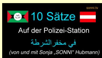
Auf der Polizei-Station