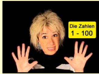
Die Zahlen „100-1000“