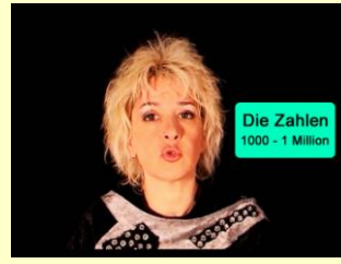
Die Zahlen „1000-1 Million“