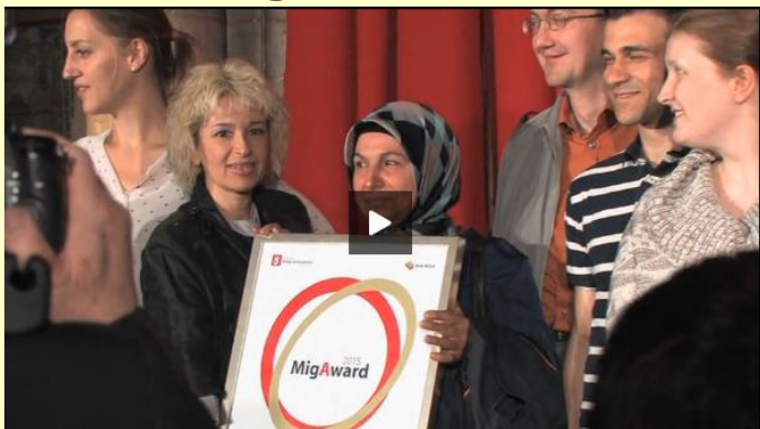
Das Sprachencafé ist das „Projekt des Jahres 2015“